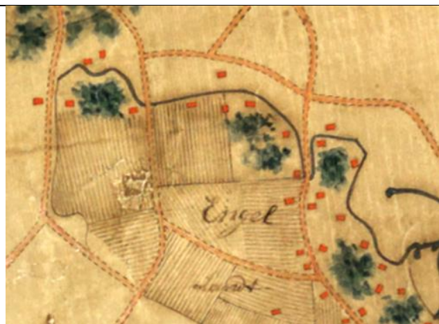
Figuur 1 Willem Leenen 1750

In uiterste noorden lijkt nog iets speciaals aan de hand. Op de kaart van Willem Leenen van rond 1750 is te zien hoe de Oude Beek destijds niet begon op het Engeland, zoals nu en ook op de kadastrale kaart uit 1832, maar verder westelijk begon. Het lijkt er op dat deze bovenloop de erfgronden, wegen en ook de enkwal volgde. Deze mogelijke beekloop zou ook meteen een verklaring zijn voor de dubbele enkwal die aan het uiterste westen van het Engeland werd aangetroffen.